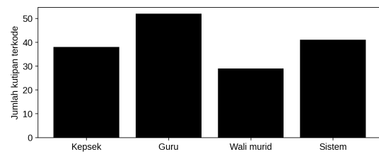
Gambar 1 Intensitas Tema

Pengodean data memperlihatkan tema dominan terkait penguatan disiplin oleh guru melalui manajemen kelas. Tema ini menguat pada uraian praktik pengelolaan kelas, penetapan aturan, penguatan perilaku, serta tindak lanjut cepat terhadap pelanggaran kecil agar tidak berkembang menjadi pelanggaran berulang.