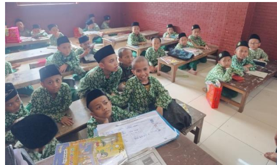
Gambar 2 Proses Pembelajaran

tulis teks keagamaan klasik. Metode Diskusi dan Refleksi Guru berperan strategis dalam mengarahkan siswa memahami isi kitab melalui pendekatan komunikatif. Diskusi dilakukan untuk mengaitkan "wasiat" dalam kitab dengan problematika adab sehari-hari siswa.