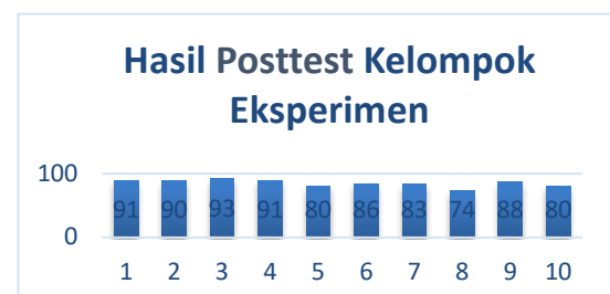
Gambar 2. Hasil Posttest Eksperimen

Menurut temuan penelitian, skor pembelajaran fonik sintesis kelompok eksperimen berkisar antara 75 hingga 90, dan hasil pra-uji digambarkan dalam grafik batang pada gambar terlampir: