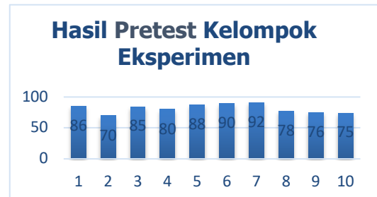
Gambar 1. Hasil Pretest Eksperimen

pada kelompok eksperimen dari penelitian ini dapat digambarkan dalam diagram batang yang disajikan pada gambar berikut: