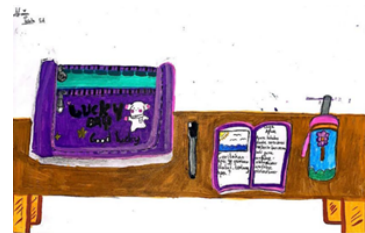
Gambar 4 Hasil Karya ANF

menampilkan salah satu tokoh wayang yang dikenalnya sebagai bagian dari seni dan kebudayaan. Ahdiyati (2025), gambar tidak hanya menampilkan bentuk visual, tetapi juga menjadi sarana bagi siswa untuk menyampaikan pengetahuan serta pemahamannya mengenai unsur kebudayaan melalui gambar.