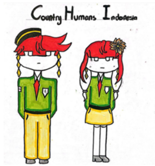
Gambar 5 Hasil Karya FANH

Analisis karya pada gambar FANH menunjukkan bahwa objek yang digambar bertema karakter, yaitu country humans dengan gaya ilustrasi anime. Dilihat dari unsur garis, gambar ini menggunakan garis tegas dan garis lengkung untuk membentuk bagian kepala, rambut, tubuh, tangan, serta pakaian karakter. Garis-garis tersebut membentuk figur manusia bergaya kartun dengan detail pada rambut, pakaian, dan aksesoris. Dari unsur bidang, gambar membentuk bidang figur manusia yang terlihat dari bentuk kepala, badan, tangan, serta pakaian yang dikenakan oleh karakter laki-laki dan perempuan. Pada unsur warna, terlihat penggunaan beberapa warna yang membedakan setiap bagian seperti warna pada rambut, pakaian, celana,