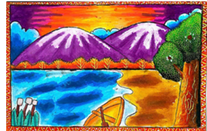
Gambar 1 Hasil Karya FUAZ

Hasil karya siswa dianalisis secara representatif dengan menyajikan beberapa contoh berdasarkan pengelompokan tema.