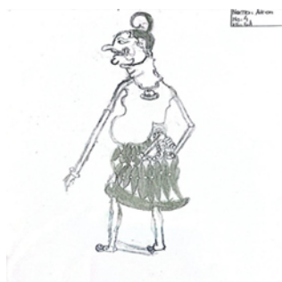
Gambar 3 Hasil Karya ARA Karya pada gambar ARA menunjukkan bahwa objek yang digambar bertema seni kebudayaan dengan tokoh wayang Petruk. Dilihat dari

terinspirasi dari imajinasinya sendiri kemudian menuangkannya ke dalam gambar. Isi cerita pada gambar menggambarkan sebuah akuarium ajaib yang di dalamnya terdapat beberapa hewan air seperti ikan dan kura-kura. Hewan-hewan tersebut diberi nama Susi, Sasi, Sisa, dan Shinta. Akuarium tersebut disebut ajaib karena siapa pun yang masuk ke dalamnya dapat langsung berpindah ke pulau lain. Melalui gambar tersebut siswa menggambarkan dunia imajinasi yang berisi hewan-hewan air yang hidup di dalam akuarium yang memiliki kekuatan khusus sehingga terlihat menarik dan unik.