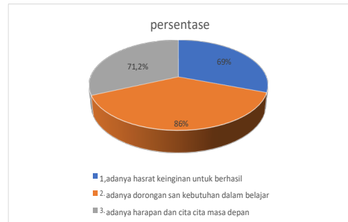
Gambar 2.2 chart pie indikator tingkat motivasi belajar

Berdasarkan data tersebut tingkat motivasi belajar siswa diSDN2 MEKARUKTI tergolong dalam kategori sangat tinggi dengan presentase 20% “tinggi” dengan presentase 60% “sedang dengan presentase ”20%dan o siswa yang tergolong dalam kategori rendah dan sangat rendah “dengan presentase 0% peneliti membuat 3 indikator tingkat motivasi belajar merujuk pada teori uno dengan presentase di bawah ini