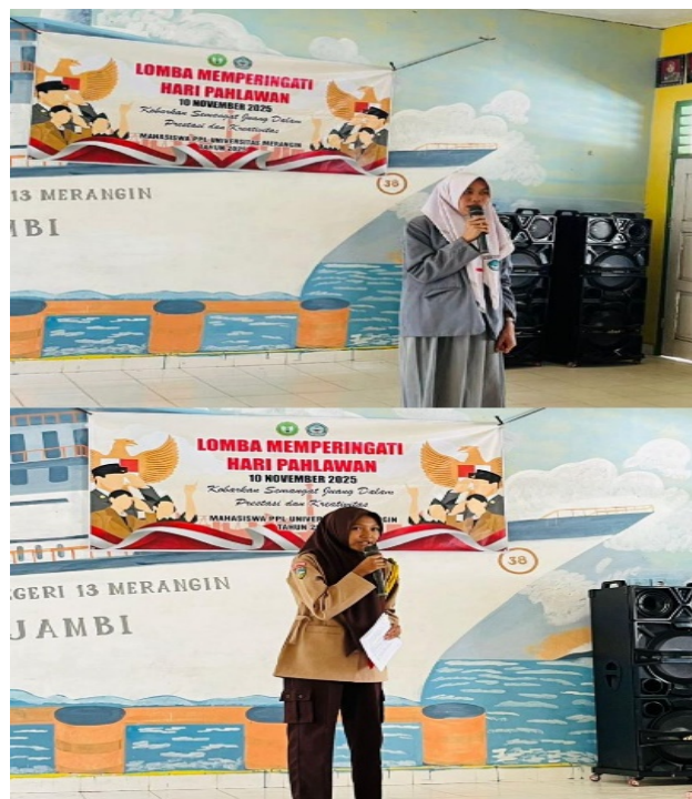
Gambar 3. Kegiatan lomba berpidato bertema pahlawan

Kegiatan lomba kedua dilaksanakan pada tanggal 25 November 2025. Mulai pukul 10.50 s/d 12.10 Perlombaan ini dimulai dari siswa/i, Yaitu lomba kedua pidato