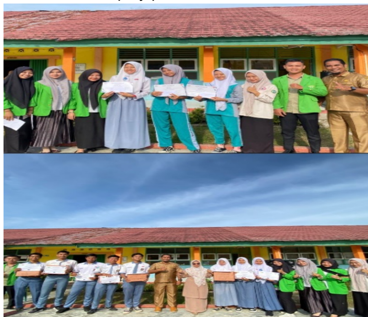
Gambar 11. Kegiatan foto bersama siswa/i pemenang lomba Hari Pahlawan 10 November