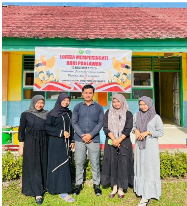
Gambar 1. Pembukaan Kegiatan Lomba Hari Pahlawan SMAN 13 Merangin

Dalam pelaksanaannya, kegiatan dilakukan selama 1 hari, dimulai dengan pembukaan perlombaan pada tanggal 10 November 2025