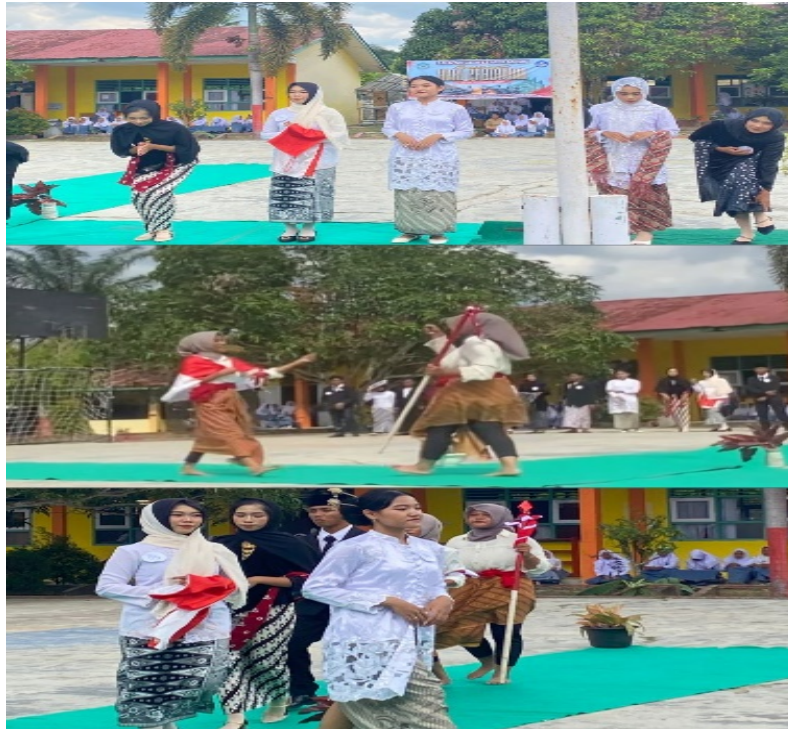
Gambar 6. Kegiatan Lomba fashion show cosplay pahlawan nasional

Kegiatan lomba keempat dilaksanakan pada tanggal 25 November 2025. Mulai pukul 14.20 s/d selesa Perlombaan ini dimulai dari siswa/i, Yaitu lomba keempat fashion show cosplay pahlawan nasional