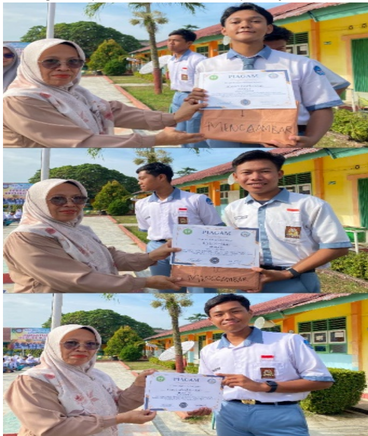
Gambar 9. Kegiatan pemberian hadiah kepada juara lomba menggambar