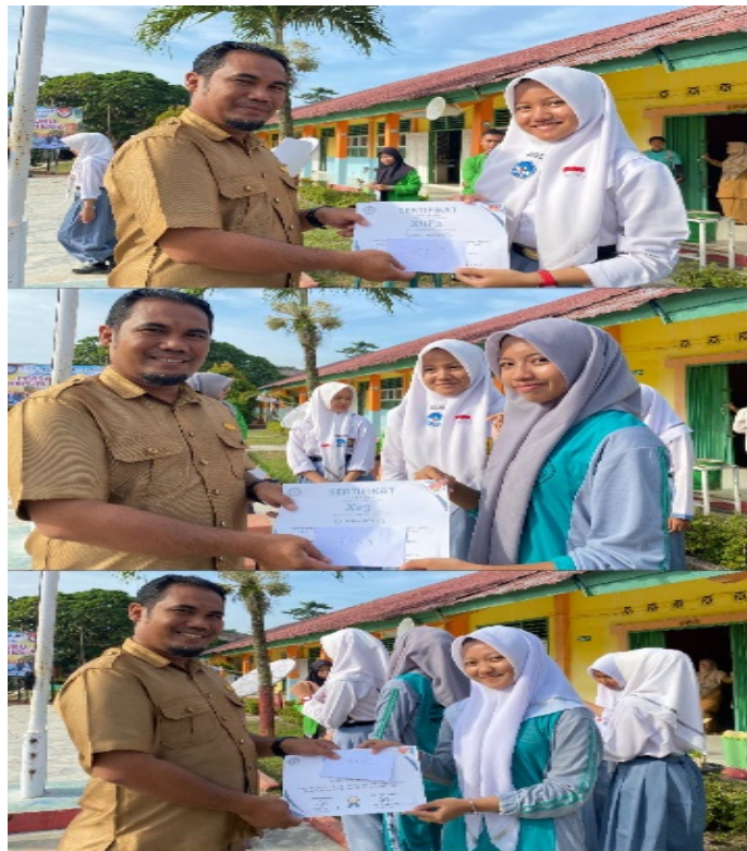
Gambar 10. Kegiatan pemberian hadiah kepada juara lomba fashion show cosplay pahlawan nasional