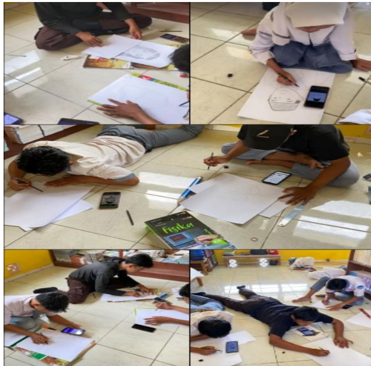
Gambar 4. Kegiatan lomba menggambar bertema kepahlawanan

Kegiatan lomba ketiga dilaksanakan pada tanggal 25 November 2025. Mulai pukul 12.45 s/d 14.15 Perlombaan ini dimulai dari siswa/i, Yaitu lomba ketiga menggambar bertema kepahlawanan