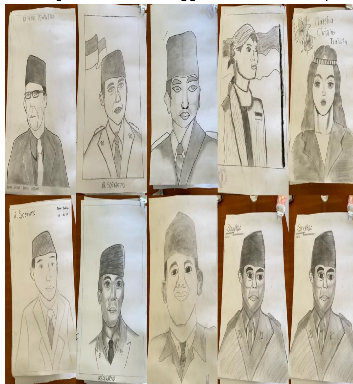
Gambar 5. Hasil peserta menggambar siswa/i SMAN 13 Merangin