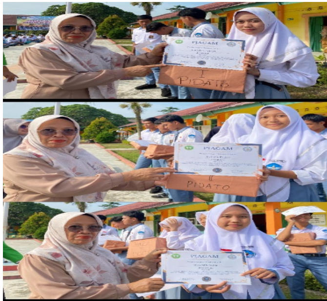
Gambar 8. Kegiatan pemberian hadiah kepada juara lomba berpidato