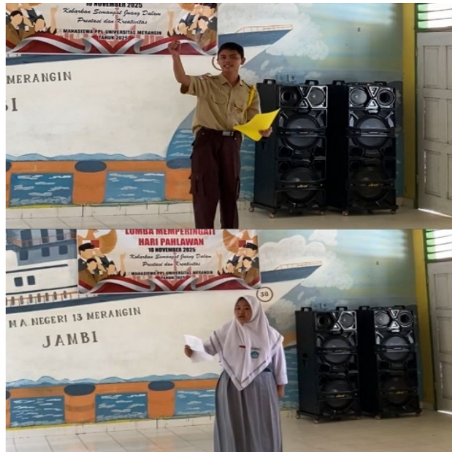
Gambar 2. Kegiatan lomba membaca puisi bertema pahlawan

Kegiatan lomba pertama dilaksanakan pada tanggal 25 November 2025. Mulai pukul 09.00 s/d 10.30. Perlombaan ini dimulai dari siswa/i . Yaitu lomba pertama nya membaca puisi bertema pahlawan.