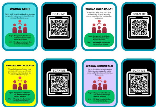
Gambar 3. Kartu Korsa Bhinneka

Keseluruhan komponen ini dirancang untuk menghadirkan unsur permainan yang bertujuan memperdalam pemahaman siswa terhadap materi yang tersedia dalam SIBUDI. Berikut disajikan tampilan media pendukung yang telah dirancang sebagai bagian dari satu paket produk pembelajaran.