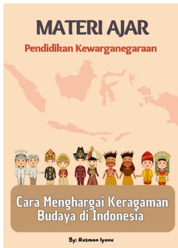
Gambar 2. Buku Materi

ini didasarkan pada hasil analisis kebutuhan serta kesesuaian dengan capaian pembelajaran di sekolah dasar. Berikut ini bentuk rancangan awal dari buku materi PKn yang telah dirancang dalam penelitian ini.