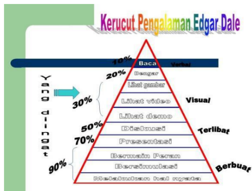
Gambar 4.3 Kerucut Pengalaman Edgar Dale dalam (Sari Pusvyta, 2019)

Konsep tersebut juga dapat dijelaskan melalui kerucut pengalaman Edgar Dale, bahwa penggunaan bahan ajar SIBUDI berbantuan Kartu Korsah Bhinneka termasuk dalam kategori pengalaman belajar konkret pada tahap “melakukan”. Pada tahap ini, siswa tidak hanya menyimak materi yang disampaikan, tetapi turut terlibat dalam aktivitas nyata seperti berdiskusi, bermain peran, bekerja sama, serta memecahkan permasalahan yang berkaitan dengan materi keragaman budaya Indonesia. Keterlibatan langsung tersebut memungkinkan siswa memperoleh pengalaman belajar yang lebih mendalam dan bermakna.