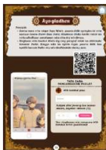
Gambar 7. Tampilan Desain Padlet

Platform interacty.me merupakan situs yang memiliki layanan interaktivitas yang dapat digunakan dalam kegiatan pembelajaran, dalam konten tersebut memiliki beberapa model konten yang menarik sehingga mampu menumbuhkan semangat belajar peserta didik (Afandi, 2025:256). Penggunaan platform tersebut, pada media pembelajaran “ E-Storybook Sayu Wiwit ” membantu dalam penyesuaian dalam menyusun game interaktif seperti kartu buka tutup. Game interaktif kartu buka tutup diintegrasikan untuk pemahaman peserta didik dalam memahami unsur intrinsik didalam sebuah cerita “ Sayu Wiwit ”.