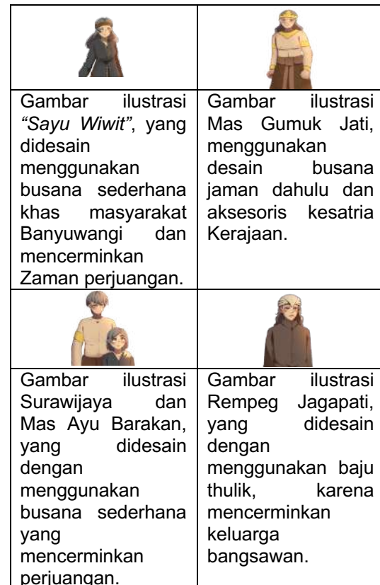
Tabel 2. Desain Tokoh Cerita

Setelah desain tokoh selesai, kegiatan yang dilaksanakan selanjutnya adalah mendesain halaman media “ E-Storybook Sayu Wiwit ” pada aplikasi Canva . Desain halaman cerita tersebut menyesuaikan proporsi tata letak ( layout ). Dalam proses perancangan media, layout merupakan kegiatan untuk mengatur dan menyusun elemen-elemen yang dibutuhkan di dalam sebuah desain tertentu sesuai dengan rancangan kebutuhan (Fuad, 2025:242). Susunan penggunaan latar, tokoh, teks cerita, dan fitur