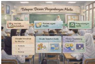
Gambar 2. Alur Desain Pengembangan Media

Alur kegiatan yang dilaksanakan peneliti dimulai dari analisis kebutuhan, hal tersebut dilaksanakan melalui kegiatan observasi dan wawancara terhadap guru serta peserta didik. Tahap selanjutnya adalah perancangan media, yang dilaksanakan dengan cara menyusun konsep media, materi dan desain tampilan media. Selanjutnya pengembangan media yang dikembangkan menjadi “ E-Storybook Sayu Wiwit ”, dengan dukungan platform heyzine.com serta penggunaan media interaktif pendukung. Setelah produk media yang telah dikembangkan mencapai tahap jadi peneliti melaksanakan kegiatan validasi kepada tiga ahli yaitu ahli materi, ahli media dan ahli pembelajaran. Tahap terakhir setelah melaksanakan validasi para ahli dan