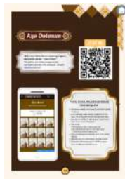
Gambar 6. Tampilan Game Kartu Buka Tutup

peserta didik mengenal sejarah kearifan lokal yang ada di sekitarnya.