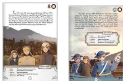
Gambar 3. Desain Halaman Cerita Rakyat

pendukung menyesuaikan dengan proporsi setiap elemen. Bentuk rancangan desain tampilan cerita seperti gambar dibawah ini.