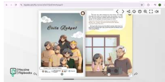
Gambar 8. Tampilan Platform Heyzine flipbook

komputer dengan dukungan tampilan pendukung dan interaktivitas (Harmuli, 2025:1180). Pengembangan media “ E-Storybook Sayu Wiwit ” pada platform tersebut menggunakan fitur suara sebagai background yang berisikan dua lagu khas Banyuwangi yaitu Umbul-Umbul Blambangan (Andang CY) dan Sayu Wiwit (Bpk. Supranoto). Elemen yang dirancang sebagai pendukung kegiatan pembelajaran, sehingga peserta didik mampu mengeksplor dan memberikan pengalaman baru dalam kegiatan belajar.