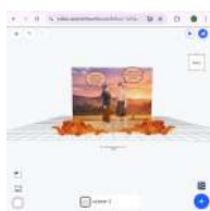
Gambar 4. Tampilan Desain AR Penggunaan elemen

Media pembelajaran interaktif dirancang untuk membantu kegiatan belajar mengajar, untuk meningkatkan efektivitas dan keterlibatan (interaksi aktif) peserta didik dalam proses pembelajaran (Yusnan, 2025:39). Media “ E-Storybook Sayu Wiwit ” menggunakan beberapa platform media interaktif digital seperti assemblr EDU , Heyzine flipbook , genially . Platform tersebut mendukung interaktivitas dan daya tarik peserta didik untuk meningkatkan minat membaca.