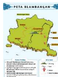
Gambar 5. Tampilan Pop-Up Gambar

menggunakan objek dua dimensi atau tiga dimensi mampu memberikan gambaran realistik terhadap peserta didik dalam meningkatkan interaksi, partisipasi, serta memberikan motivasi belajar pada masa perkembangan teknologi (Berlian dkk., 2024:382). Penggunaan platform tersebut menambahkan daya tarik peserta didik, dalam mengimajinasikan gambar yang disertai dengan teks percakapan, sehingga dengan metode AR tersebut peserta didik dapat mengeksplor isi cerita dengan model tertentu.