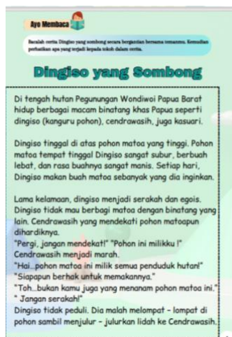
Gambar 3 Cerita Tentang Hewan Khas Papua

seperti rumah adat, makanan tradisional, dan hewan asli Papua.