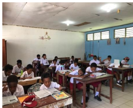
Gambar 4 Uji Coba Kelompok Kecil

pertanyaan untuk mengetahui pemahaman siswa setelah belajar menggunakan buku siswa. Hasil uji coba menunjukkan bahwa petunjuk penggunaan buku jelas, gambar dan warna buku menarik sehingga siswa bersemangat dalam belajar membaca menulis permulaan. Selain itu buku mudah digunakan dan siswa tidak merasa kesulitan dalam mengerjakan latihan yang ada pada buku siswa.