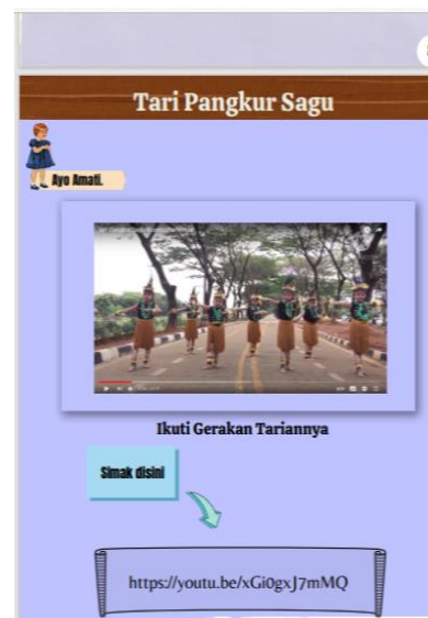
Gambar 2 Pengenalan Tarian Khas Papua Materi cinta tanah air dikembangkan dengan menggunakan berbagai hal yang sesuai dengan budaya lokal Papua

Tahap ketiga: development (pengembangan). Pada tahap pengembangan dilakukan penentuan isi materi, validasi, dan produksi. Isi materi dari buku siswa dikembangkan menjadi buku panduan sekaligus aktivitas yang merangsang siswa untuk terlibat aktif dalam pembelajaran. Struktur penulisan buku dikembangkan untuk memfasilitasi pengalaman belajar yang bermakna berdasarkan tema cinta tanah air.